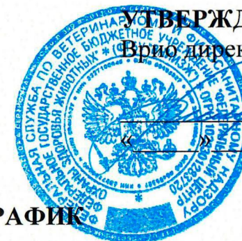
График одобрен Ученым советом ФГБУ «ВНИИЗЖ» Протокол № 8 от 09 октября 2020 г.

Региональная референтная лаборатория МЭБ по ящуру. Центр МЭБ по сотрудничеству в области диагностики и контроля болезней животных для стран Восточной Европы, Центральной Азии и Закавказья. Референтный центр FAO по ящуру для стран Центральной Азии и Западной Евразии