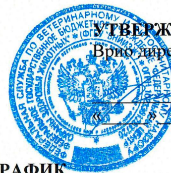
График одобрен Ученым советом ФГБУ «ВНИИЗЖ» Протокол № 8 от 09 октября 2020г.

Региональная референтная лаборатория МЭБ по ящуру. Центр МЭБ по сотрудничеству в области диагностики и контроля болезней животных для стран Восточной Европы, Центральной Азии и Закавказья. Референтный центр ФАО по ящуру для стран Центральной Азии и Западной Евразии